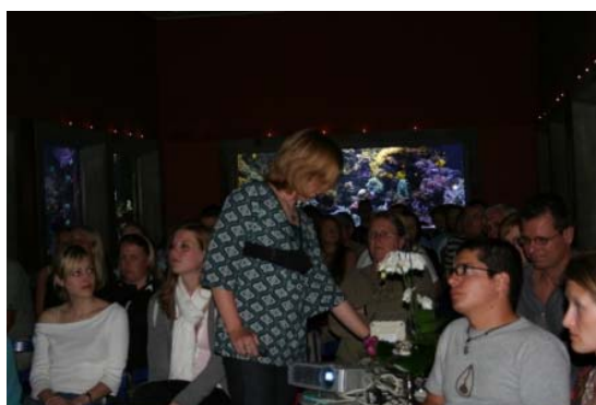
Figur 2. Irrelevant stemningsbillede fra et tidligere arrangement i DHF-regi.

Titel og forfattere formateres som i dette eksempel og teksten i fontstørrelse 12 og margener på 3,17 cm i højre og venstre side, samt 2,54 cm i top og bund må i så fald ikke overstige en A4-side.